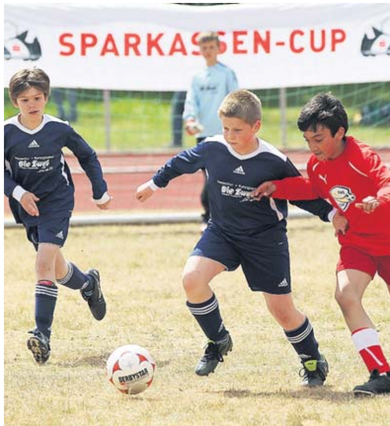
Packende Zweikämpfe lieferten sich die E-Jugendsspieler und -spielerinnen aus dem Landkreis Cuxhaven beim Sparkassen-Cup 2011.

Die JSG Bokel-Langensfelde-Stubben hatte Los-Glück und gewann zehn Trainingsbälle. (nz)